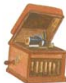
Pág. 35 Capítulo Cuatro Obras son amores