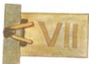
Pág. 59 Capítulo Siete A la medida de lo imposible