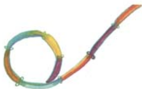
Pág. 43 Capítulo Cinco Una cometa sin cola