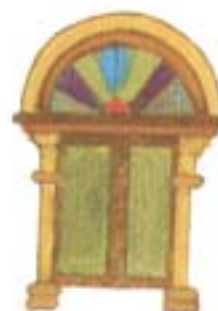
Pág. 51 Capítulo seis Largas distancias